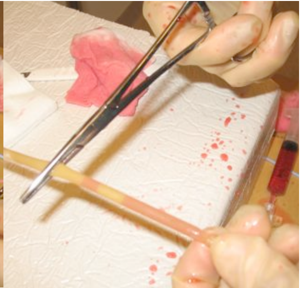
Bild 5. Gummislangen kläms proximalt om hålet