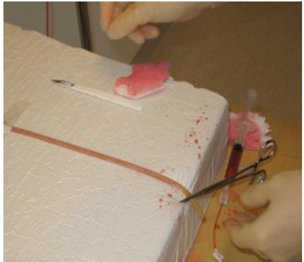
Bild 7. Gummislangen fixeras mot underlaget med hjälp av nålföraren