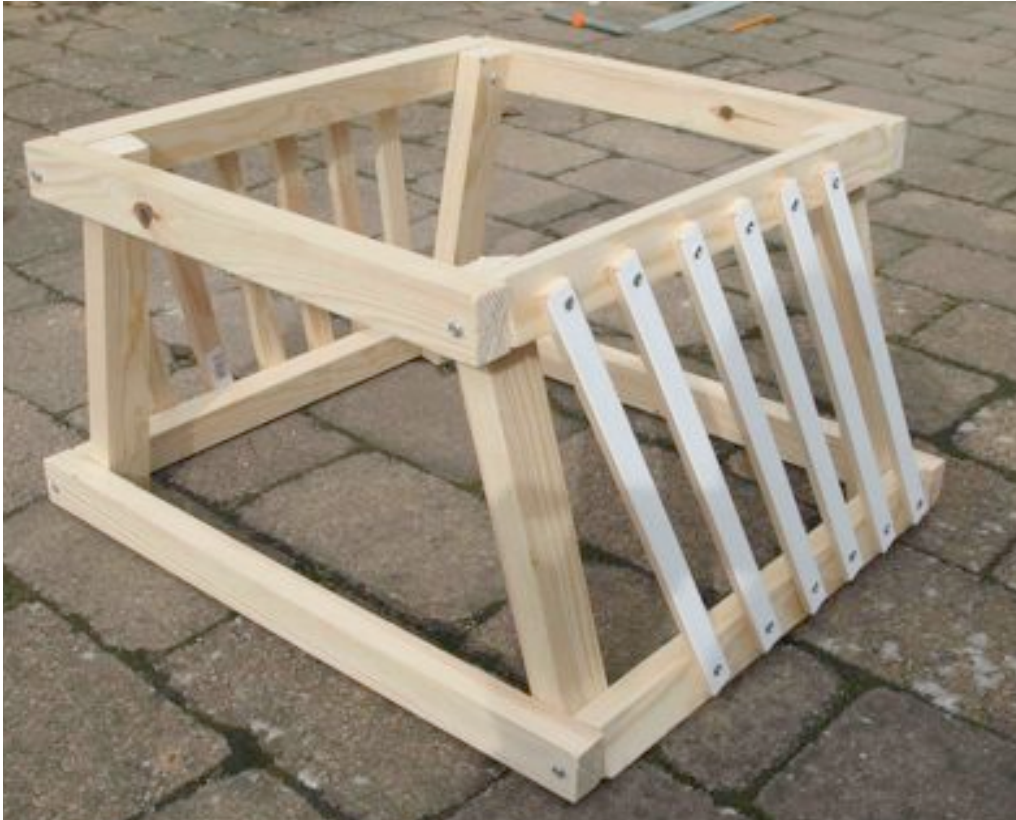
Bild 3. Smyglisten kapas: 26 cm långa delar som skruvas på thorax som revben