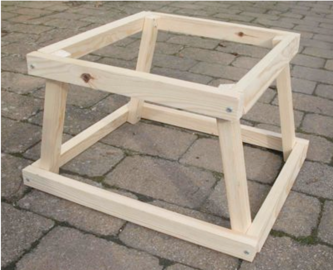
Bild 2. Furulisten kapas: 4 st 25 cm, 6 st 35 cm och 2 st 45 cm bitar som skruvas ihop