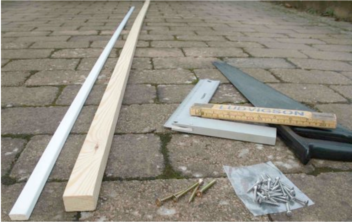
Bild 1. Material.