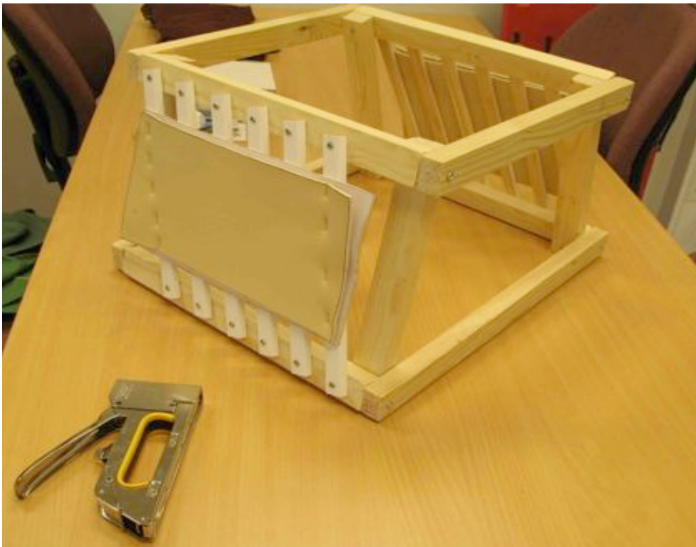
Bild 4. Huddyna häftas på revbenen