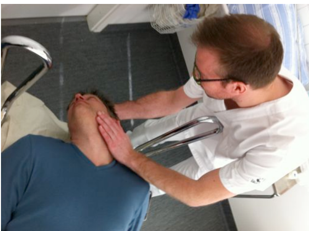
Position 1 (Sjuka örat mot golvet)