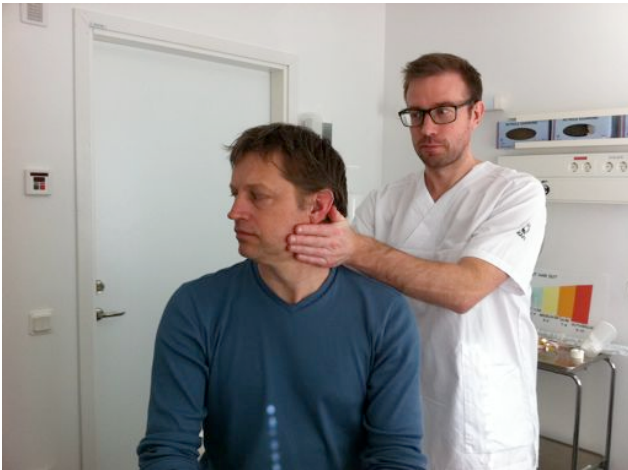
Startposition (Epleys manöver för höger balansorgan)